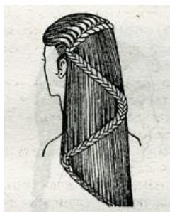
Рисунок 2 – Коса – «змейка»

Все иллюстрации должны быть пронумерованы (внизу, по центру), как показано на Рисунке 2. Нумерация сквозная, т.е. через всю работу. Если иллюстрация в работе единственная, то она не нумеруется.